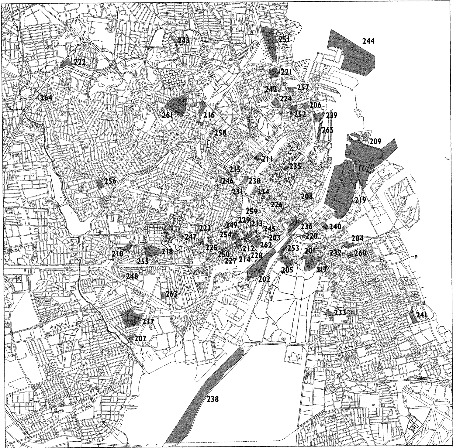
Lokalplaner 201 - 265