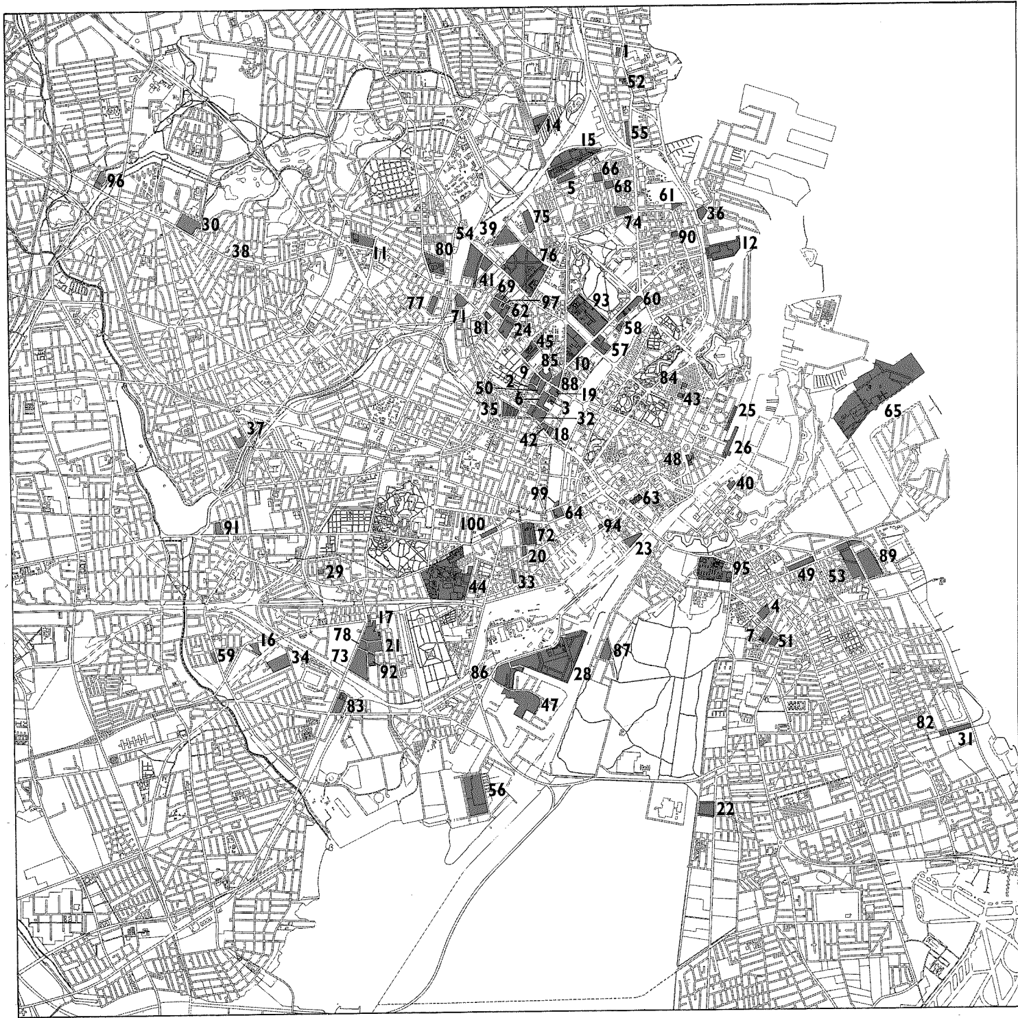
Lokalplaner 1 - 100